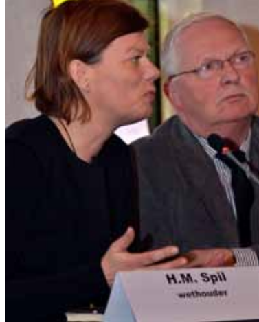
Wethouder Spil: "Organisaties zijn zich bewust dat we gezamenlijk naar oplossingen moeten kijken."

Alle subsidieaanvragers zijn in de gelegenheid gesteld om zowel