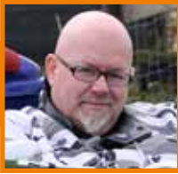
Tekst en foto's Patrick Hesse