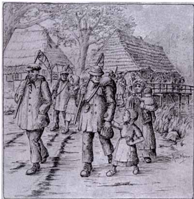
Uittocht van de Nederlandtrekkers uit hun dorp

Vanaf de zestiende eeuw kwamen elk jaar duizenden vreemdelingen, voornamelijk Duitsers, naar Nederland om op het land of in de veenderij wat bij te verdienen. En wij mogen stellen dat zonder de inbreng van deze gastarbeiders onze Gouden Eeuw niet tot de ons welbekende bloei zou zijn gekomen. De totale omvang van deze jaarlijks terugkerende volksverhuizing wordt op vijf miljoen migraties geschat. Dit verschijnsel, dat later bekendheid kreeg onder de naam Hollandgangers, heeft zich ook voorgedaan gedurende het veenderijgebeuren in De Ronde Venen en velen van hen zijn hier gebleven en nooit meer teruggegaan. Op uitnodiging van de werkgroep genealogie van de historische vereniging De Proosdijlanden is genealoog Jos Kaldenbach uit Alk-